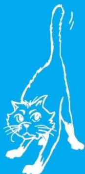
Temătorul în dragoste